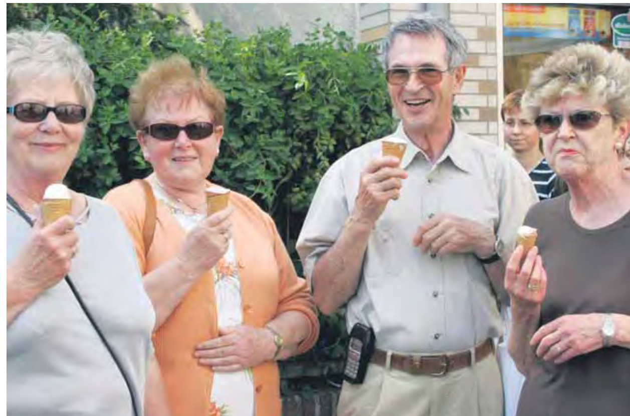
Schönes Wetter und viele Menschen auf den Straßen, die die ersten wärmenden Sonnenstrahlen genießen – das wünscht sich der Gewerbeverein Großauheim für den Irminratsmarkt am 27. April.