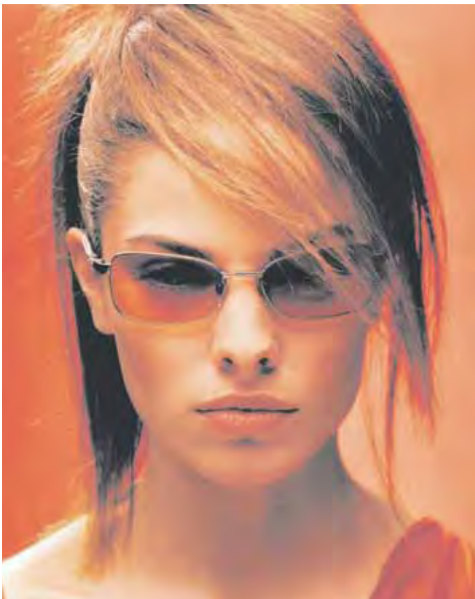
Gute Sonnenbrillen sind mehr als modische Accessoires. Sie bewahren das Auge vor Blendung und schützen auch zuverlässig vor der gefährlichen UV-Strahlung.