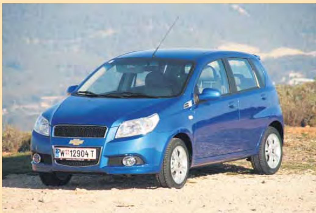
Charakteristisch: ein großer zweigeteilter Kühlergrill.