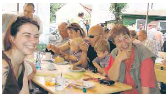
Am Sonntag trifft man sich zum gemütlichen Kaffeepausch auf der Hauptstraße in Großauheim.