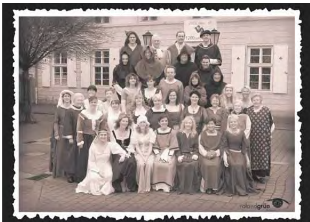
Passend zum historischen Anlass tragen die Geschäftsleute des Gewerbevereins Großauheim zum Irminratsmarkt historische Kostüme und haben ihre Geschäfte von 13 bis 18 Uhr zum ungestörten Bummeln geöffnet.