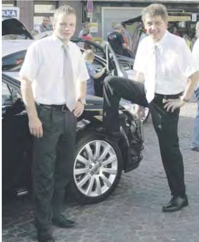
Bei den Autohändlern kann man die neuesten Modelle bewundern und auch gerne einmal probefahren. Ob dieses Auto mir wohl steht?

Als „Duo Obscurum“ ziehen Bernartius „van Troethoven“ und Bombastus „von der Heiden“ aus Dresden kommend von Stadt zu Stadt und präsentieren ihre Kunst. Hell und klar erklingt mittelalterliche Musik mit Sackpfeife und Trommel. Sie erzählen Geschichten, jonglieren, spielen Theater mit den Zuschauern und zeigen ihr Können bei Flammenspielen. Das „Duo Obscurum“ ist schon in vieler Herren Länder bekannt und gern gesehen und wird auch das Publikum auf dem Irminratsmarkt begeistern. (pm) ▷ www.duo-obscurum.de