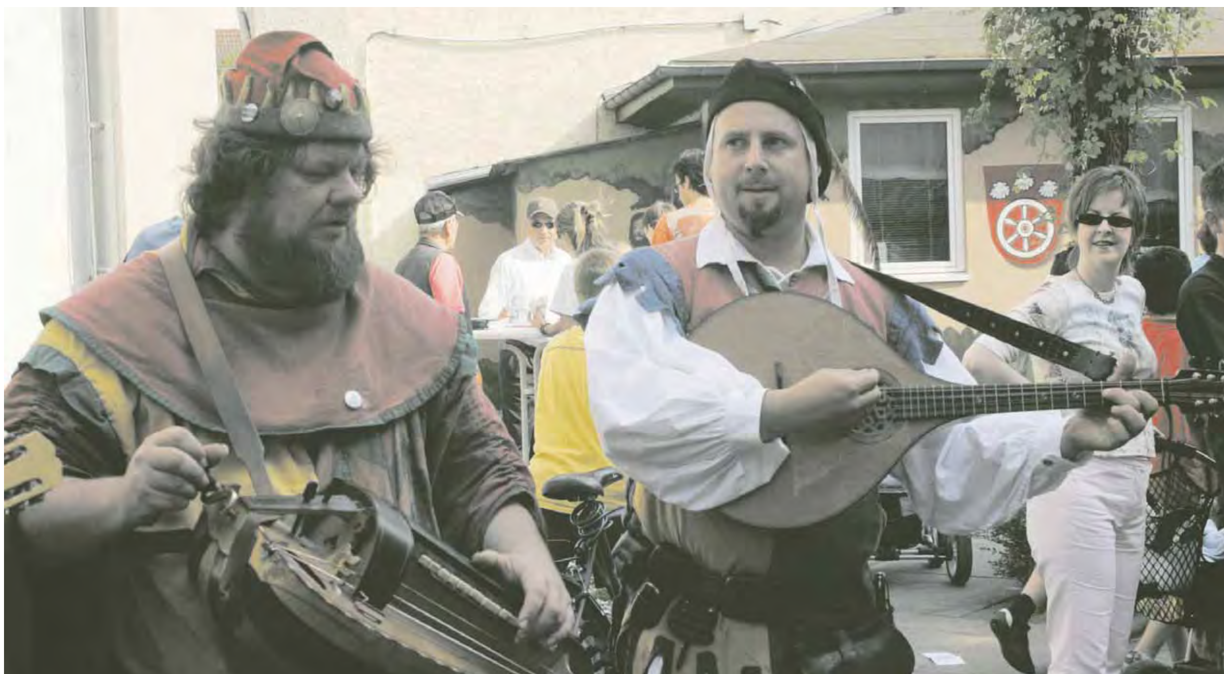
Das Mittelalter in Großauheim: Ob kämpfende Ritter, Musikanten und Gaukler – auf den Straßen wird es zugehen wie zu Zeiten der adligen Frau Irminrat.