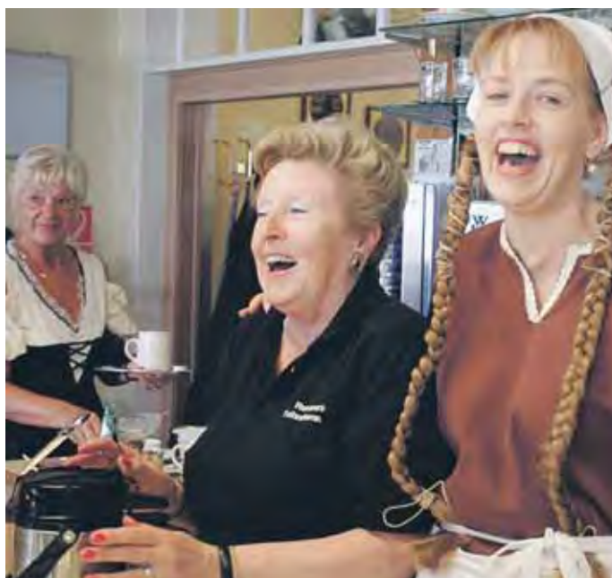
Beim Irminratsmarkt in Großauheim kann man sich in aller Ruhe in den Geschäften umsehen und von den netten Mitarbeitern in historischen Kostümen beraten lassen.