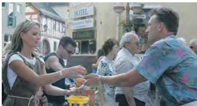
Für das leibliche Wohl wird auch auf dem Irminratsmarkt reichlich gesorgt sein.