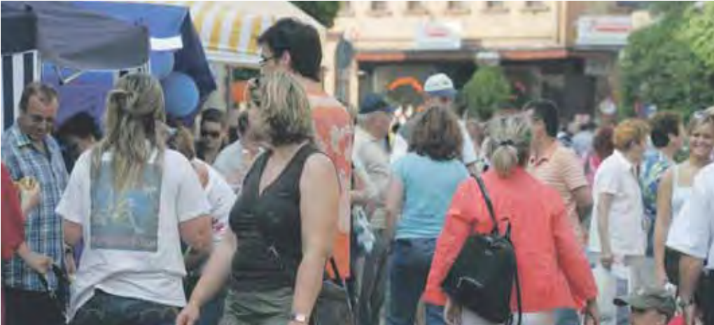
Am Sonntag, lässt es sich prima von Schaufenster zu Schaufenster bummeln. Wenn dann auch noch das Wetter mitspielt, werden die Straßen sicherlich so voll sein, wie beim vergangenen Irminratsmarkt.

Haben Sie schon mal Ihre Schuhe desinfiziert? Wir zeigen Ihnen, wie es geht! Wir freuen uns auf Ihren Besuch